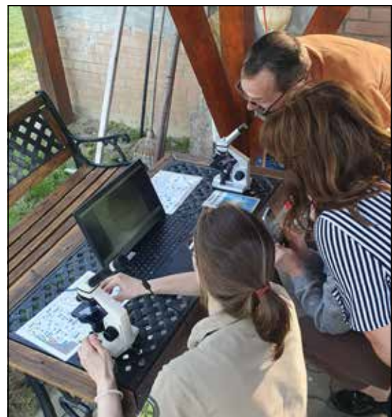
Erdőpedagógiai szakmai továbbképzés

Ez ideig egy olyan programról tudunk beszámolni, ami befejeződött. A Társaság 2023-ban az Agrárminisztérium fejezeti előirányzatából 5 millió forint támogatás nyert „ Erdészeti szakmai továbbképzések, erdőpedagógiai